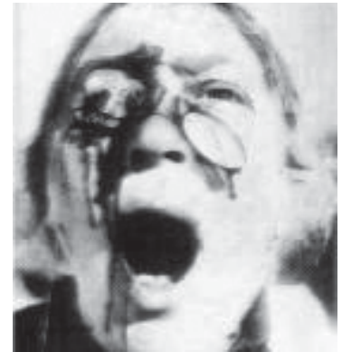
Imatges: Wikimedia Commons A dalt: Poussin. La matança dels innocents (detall). A sota: Eisenstein. El cuirassat de Potemkin.

Francis Bacon quan pinta les cares amb la boca oberta té per objectiu reflectir el crit de l'horror. I el que ell desitjaria ... és el somriure que encara mai ha aconseguit.